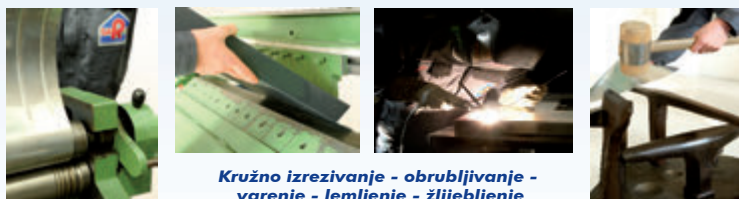
Kružno izrezivanje - obrublivanje - varenje - lemljenje - žlijebljenje

Proizvodimo sve proizvode po želji kupca - Pritom naši iskusni krovopokrivači i limari proizvode u skladu s testiranim mehaničkim načinima obrade.