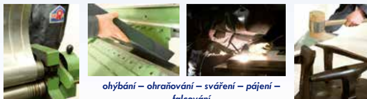
ohýbání – ohraňování – sváření – pájení – falcování